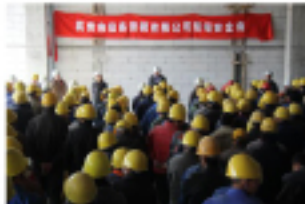
会议还要求项目部施工人员在

日前安装施工已全面展开,为建立公司安全生产职能部门与项目部安全管理机制互动协作,切实做好安全生产工作,杭安公司工会、工程部、人力资源部相关负责人分别从安全生产重要性、安全生产知识、安全事故典型案例及劳动保护职业健康等方面对员工进行了宣教,同时,要求项目部健全安全管理体系,坚持工地周、班前安全会,员工要系统学习安全知识及工种、机具设备操作规程,增强安全防范意识。