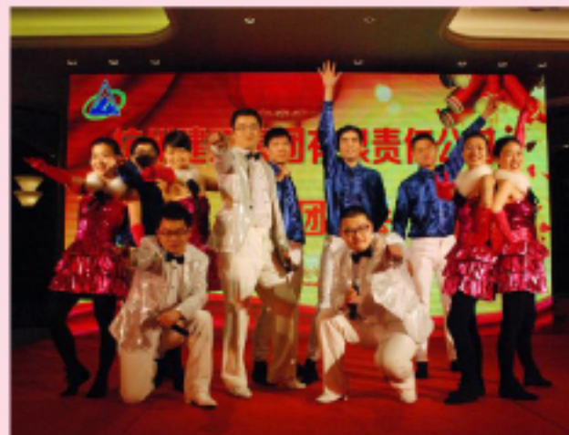
集团员工表演的歌舞《青春乐园》