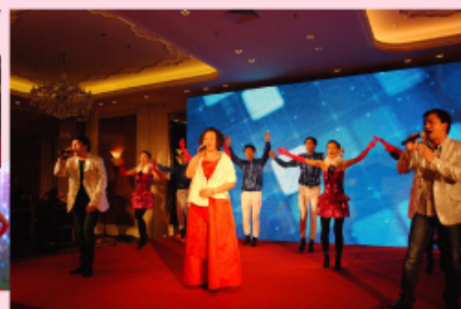
集团员工表演的歌舞《天下相亲与相爱》